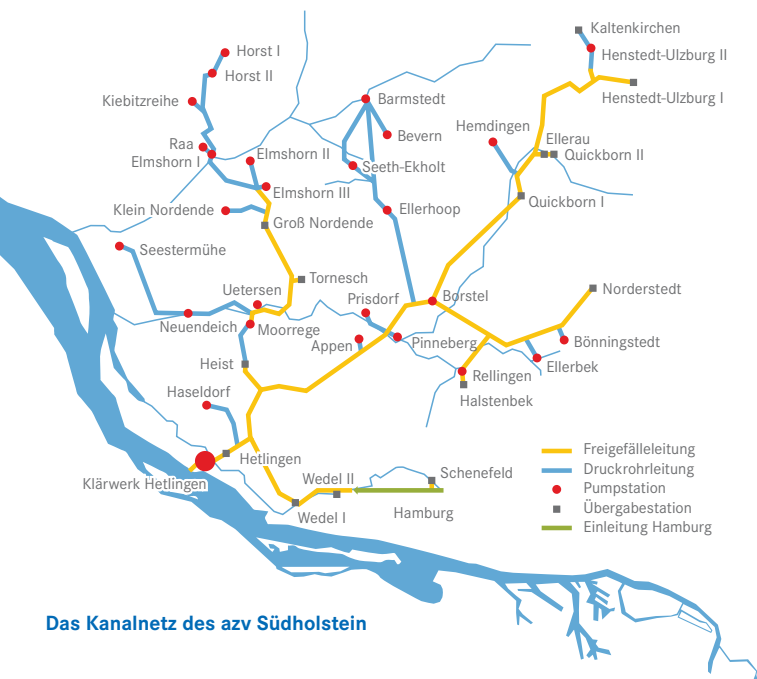
Das Kanalnetz des azv Südholstein

Mehr Informationen zum azv Südholstein finden Sie unter www.azv.sh